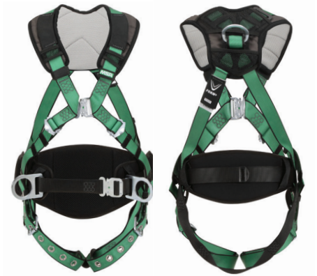
N° de pièce 10206161