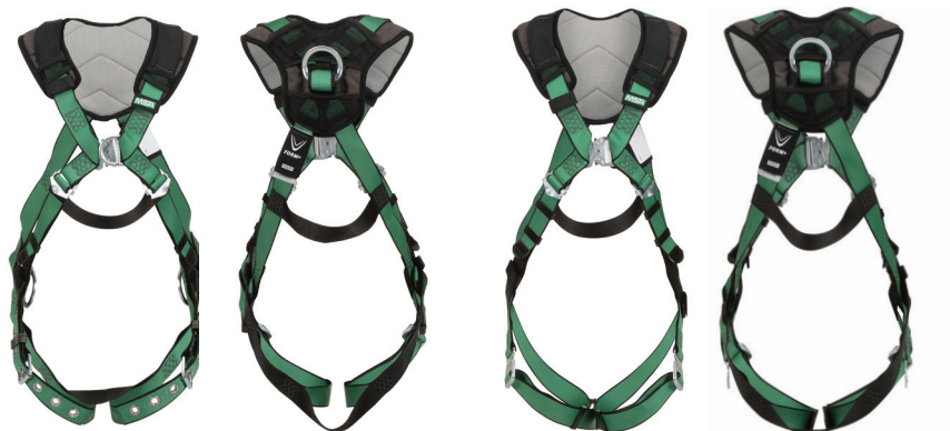
N° de pièce 10206093